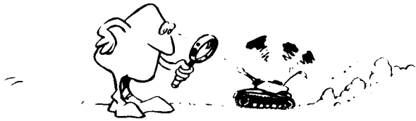
Tableau de la synthèse des attaques dirigées contre l'infanterie embarquée